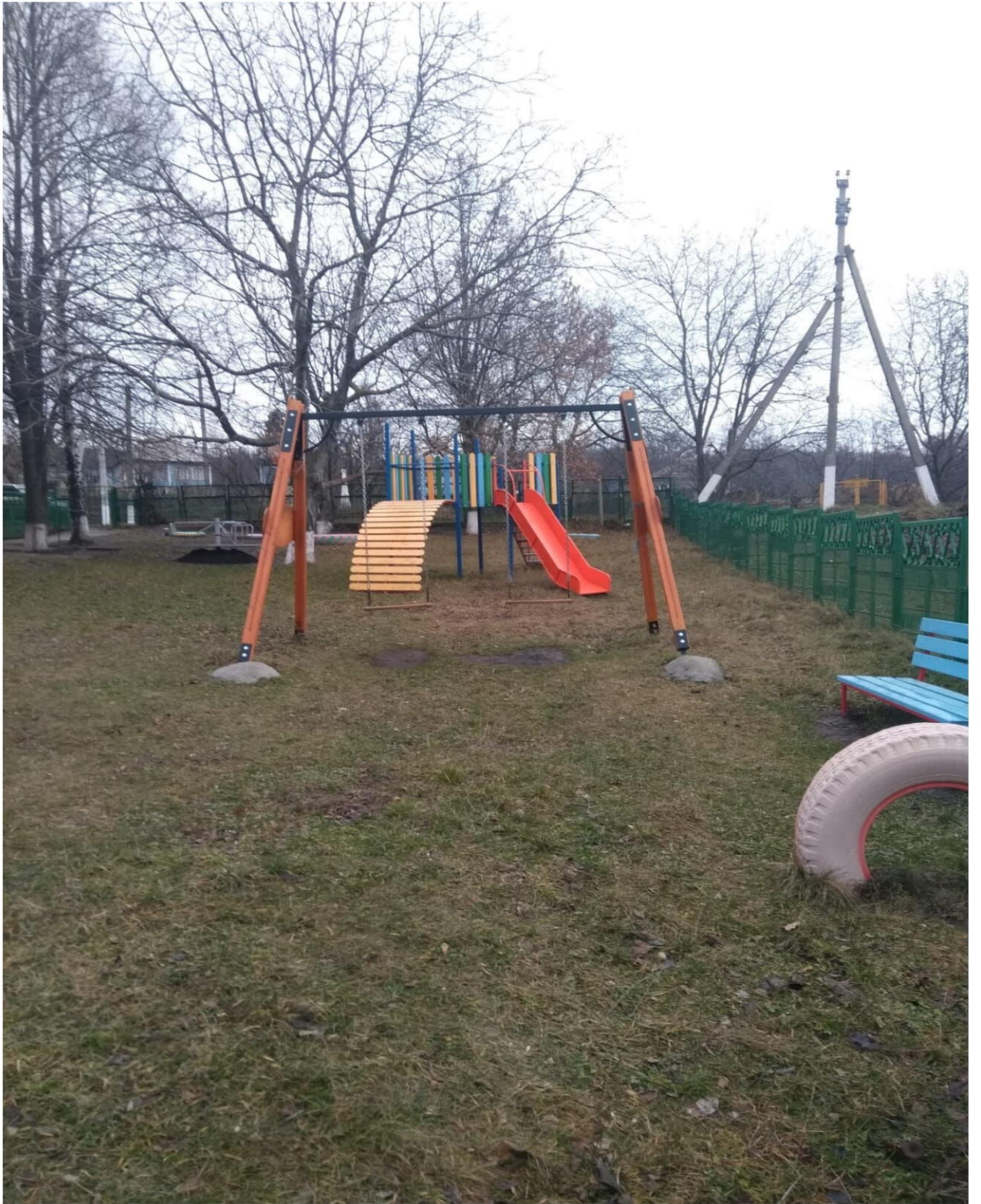
Ograda grădiniței de copii.