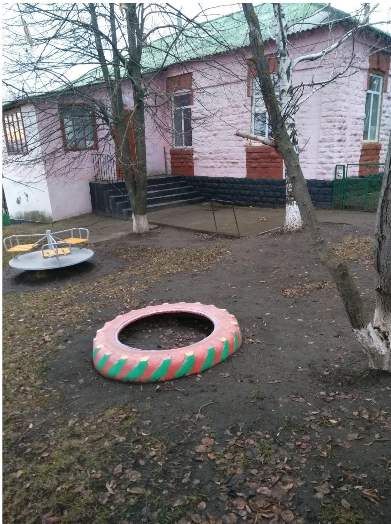
Edifiiciul grădiniței de copii, bibliotecii sătești ,oficiului medicului de familie.