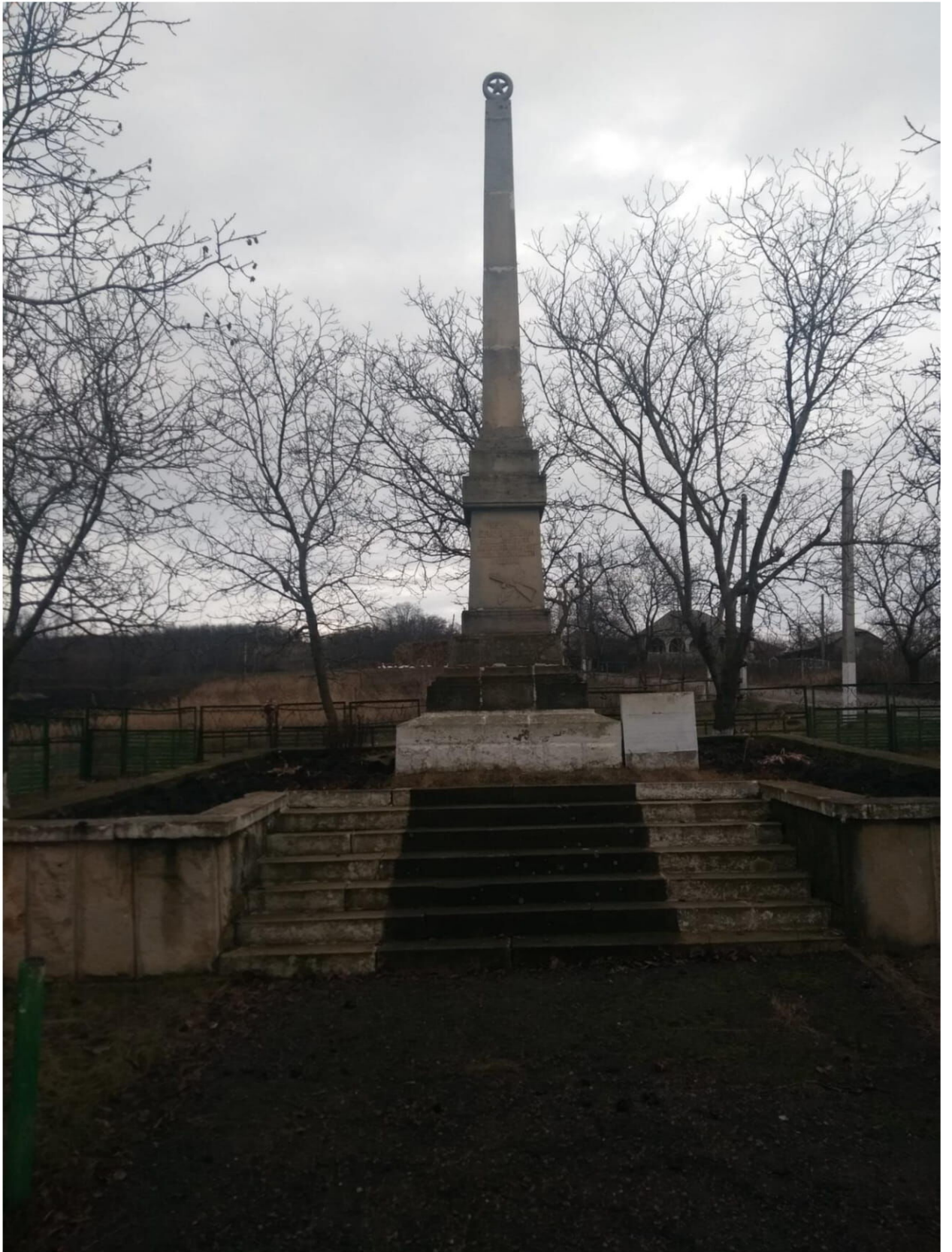
Monumentul, ridicat în memoria eroilor, căzuți în luptele celui de al doilea război mondial.