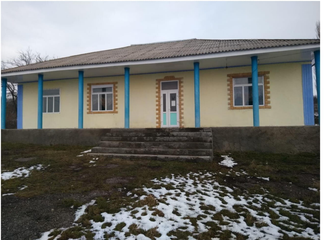
Clădirea căminului cultural.